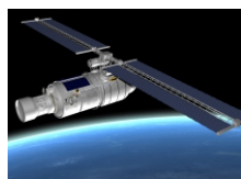
Aéronautique et Défense