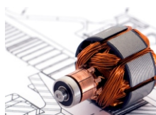
Moteurs et Transformateurs